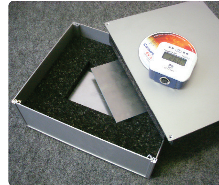
Das Drei-Schicht-Kalorimeter mit der Außenhülle und dem Probenbehälter, jeweils aus Aluminium, mit dazwischen liegendem Isolationsmaterial. Abgebildet sind zudem eine Messeinheit und die CD der Auswertungssoftware.