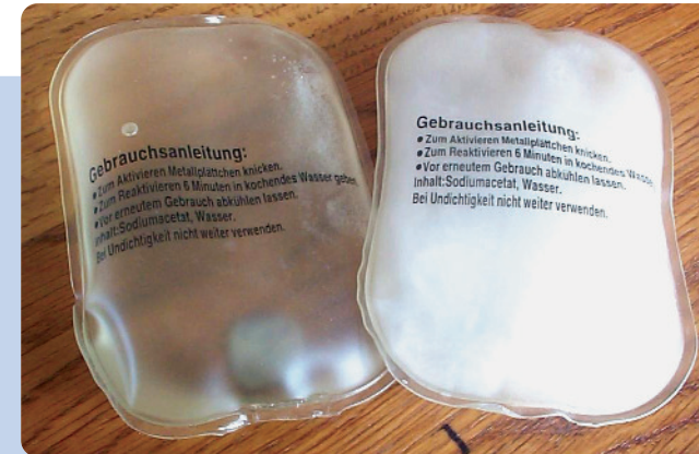
Phasenwechselmaterialien (PCM) werden beispielsweise bei Handwärmern eingesetzt, links im flüssigen, rechts im kristallisierten Zustand.