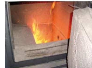
Wärme aus der Natur

Steigende Energiepreise haben Hausbesitzer im letzten Jahr arm gemacht. Heizen wurde zum Luxus. 10 Haushalte aus Byhleguhre im Spreewald wollten dem etwas entgegensetzen und beschlossen ein Nahwärmenetz mit umweltfreundlicher Energie aufzubauen.